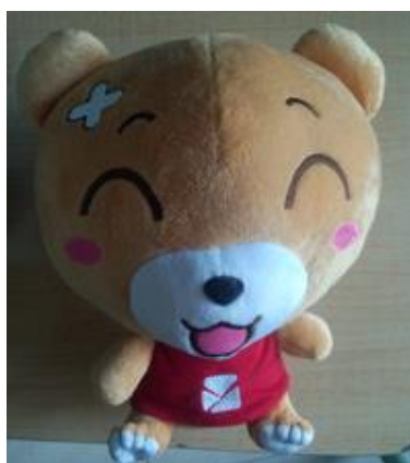
易班吉祥物——易班熊公仔